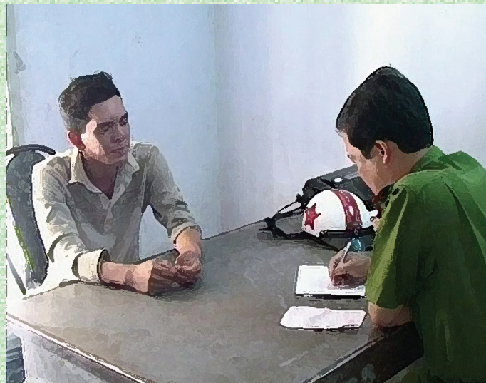
Người phòng vệ chính đáng giải trình với cơ quan công an

- Tình thế cấp thiết là tình thế của người vì muốn tránh gây thiệt hại cho quyền, lợi ích hợp pháp